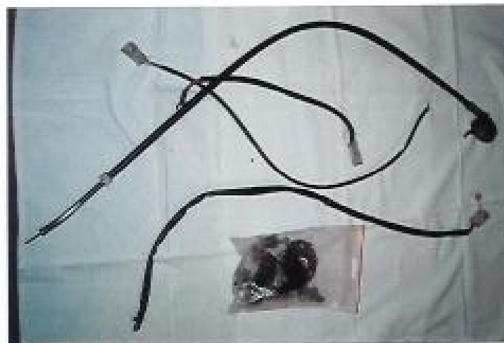
Tachoantrieb/-welle; Preis: 8€ diverse Chrom-/Befestigungsschrauben; Preis: abgebildete Kabel werden Kabelbaum h