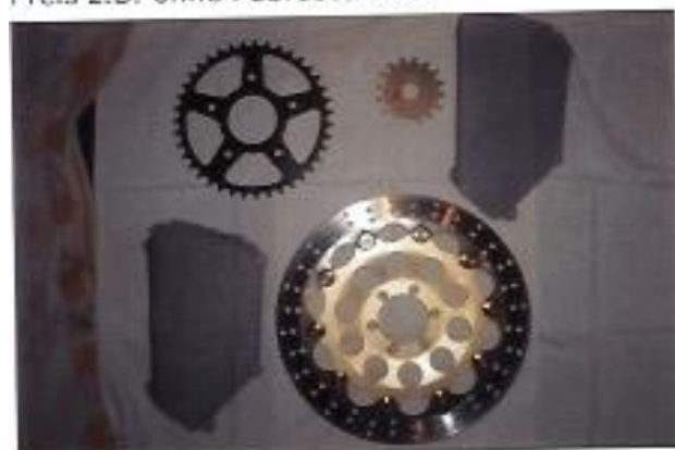
Bremsscheibe vorn; Preis: 10€ Ritzel und Kettenrad (übersetzung 16/39); Preis: 6€ Verkleidungsgitter; Preis 1€