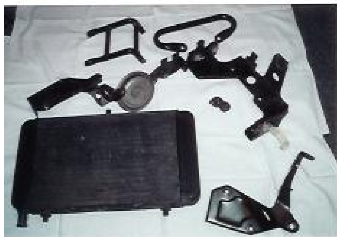
Fuel Tanker inkl. Behälter, Schläuche und Befestigungen; Preis: 10€ Soziushaltegriff; Preis: 1€ Sattelstütze inkl. Befestigung; Preis: 3€ Motor-/Kühlerhalterung mit Anbauteilen; Preis: 2€