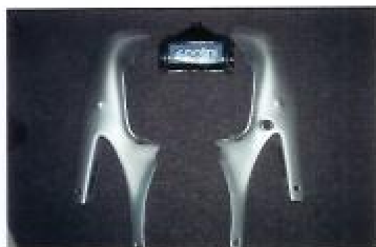
Sitzverkleidung; Preis: 5€