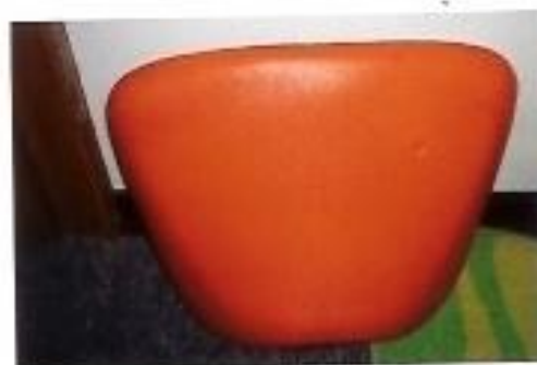
Fahrersitz (kleine Druckstelle); Preis: 5