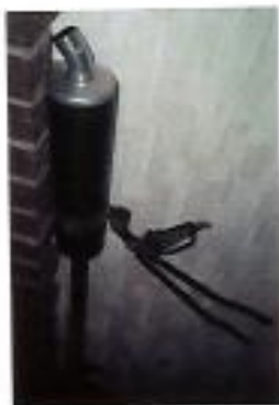
Auspuff bzw. Krümmer und Endtopf entdrosselt (Krümmer 1,5 Jahre alt) Preis z.B. ohne Fußraste: 25€