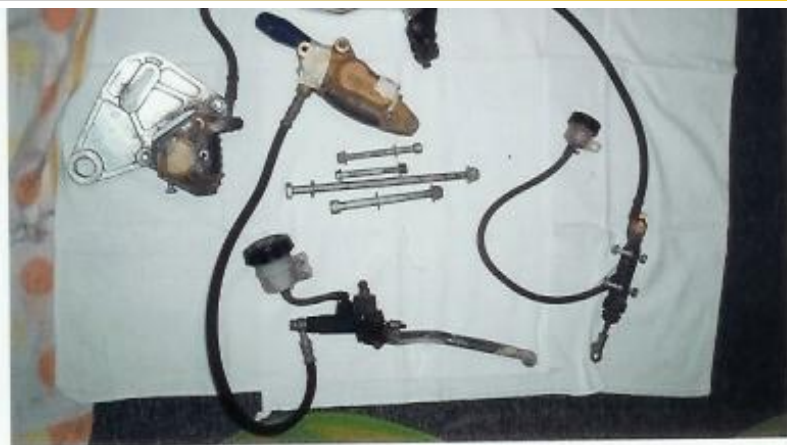
Vorderradbremse komplett; Preis: 20€ Hinterradbremse (ohne Bremspedal); Preis 20€ Schrauben zur Motorhalterung; Preis 2€