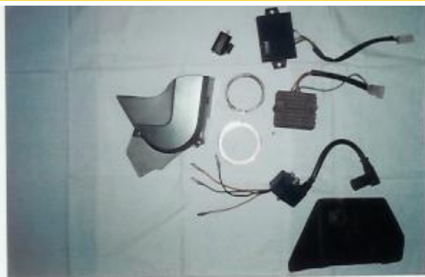
Ritzelabdeckung; Preis: 3€ Heck-/Öltanktrennung; Preis: 0,50€ Zündspule; Preis: 4€ Anlasserrelais; Preis: 2€ Steuerung für Auslasssteuerung; Preis: 15€ Spannungsregler; Preis: 15€