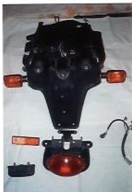
komplette Rücklichtaufhängung; Preis: 12€