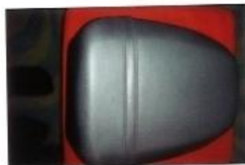
Soziussitz; Preis 8€