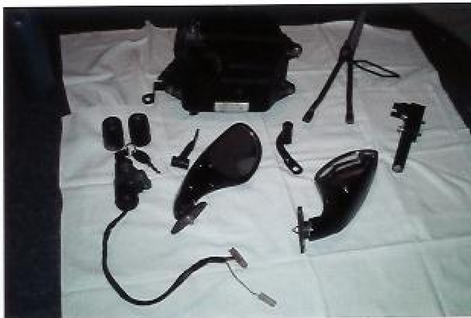
2 Spiegel; Preis: 20€ Zünd- und Sitzschloss mit Schlüsseln; Preis 12€ Luftfilterkasten; Preis: 7€ 2 Soziusfußrasten; Preis: 4€ Lenkergewichte (müssten evtl. lackiert werden); Preis 1€